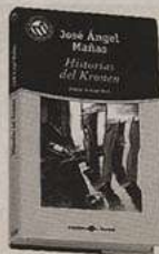
Ejemplar de la novela «Historias del Kronen», de José Ángel Mañas.

José Ángel Mañas nació en Madrid en 1971. Se licenció en Historia Contemporánea y prolongó sus estudios con cursos en Sussex y Grenoble. Su primera novela, Historias del Kronen , es la crónica de las noches sin freno y los días de resaca durante un verano. La acción transcurre en una gran ciudad como Madrid, don-